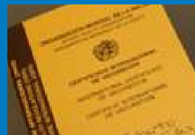
CERTIFICADO de VACUNACIÓN INTERNACIONAL (Fiebre Amarilla)