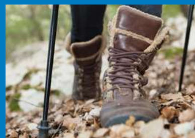
Ropa y calzado adecuado