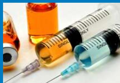
Vacunaciones necesarias Inmunizaciones recomendadas Quimioprofilaxis